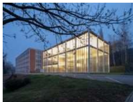
Památník Tomáše Bati ve Zlíně.

30. 4. 2021 o půlnoci skončilo hlasování veřejnosti pro vítěznou proměnu 12. ročníku národní putovní výstavy Má vlast cestami proměn – příběhy domova. Soutěžilo 118 vystavených proměn, 115 proměn z České republiky a 3 ze Slovenska. Nejlepší proměnou 13. ročníku zvolili hlasující Památník Tomáše Bati ve Zlíně. Na druhém místě se umístila Krajinná opatření v Choťovicích a na třetím Obnova pláště kostela sv. Terezie v Lesné.