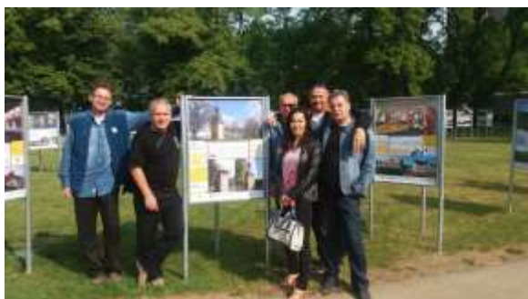
Tučnířáci prezentovali svoji kapličku.

Velké zapojení je hlavně díky podpoře Olomouckého kraje, který zájemcům o výstavu hradil vstupní příspěvek. Děkujeme Olomouckému kraji.