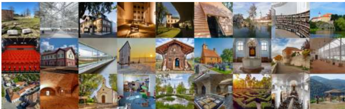
Hlasování o nejlepší proměně ročníku 2021/2022- ukázka vybraných staveb.

Od poloviny února byla před Krajským úřadem Olomouckého kraje k vidění výstava Má vlast cestami proměn 2020/2021. Projekt, který probíhá už dvanáctým rokem, představuje prostřednictvím fotografií původní a současný stav areálů či objektů, které prošly obnovou. Na osmi panelech bylo vystaveno patnáct projektů z Olomouckého a sedm z Moravskoslezského kraje. Jedná se o dílčí kolekci národní putovní výstavy Má vlast cestami proměn, kterou každoročně pořádá spolek Cestami proměn. Na panelech byly prezentovány projekty z obcí Bohuňovice, Bochoř, Dubicko, Horní Lipová, Jezernice, Kojetín, Milenov, Mohelnice, Moravský Beroun, Otaslavice, Potštát, Šumperk, Ústín a Vrchoslavice. Výstava zachycuje různorodé proměny - obnovy hřišť, přírodních biotopů, zahrad a veřejných prostor. Zámci si mohli zhlédnout nejen náročné rekonstrukce sokolovny, obecního úřadu, komunitního centra, škol a vzdělávacího centra, ale i úpravy zámku, lázni či radnice. Jedná se o jedinečnou příležitost, jak ocenit a také povzbudit úspěšné autory proměn i vyzdvihnout obce z našeho regionu. Po celé minulé léto výstava putovala obcemi Olomouckého kraje jako součást obecních slavností, hudebních festivalů, hodů, turnajů a různých letních akcí. Výstava před budovou kraje trvala do poloviny dubna.