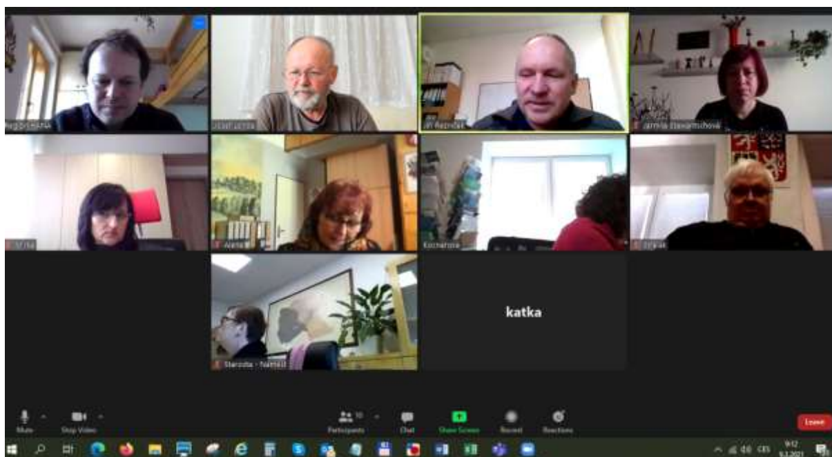
Jednání předsednictva on line dne 16.2.2021