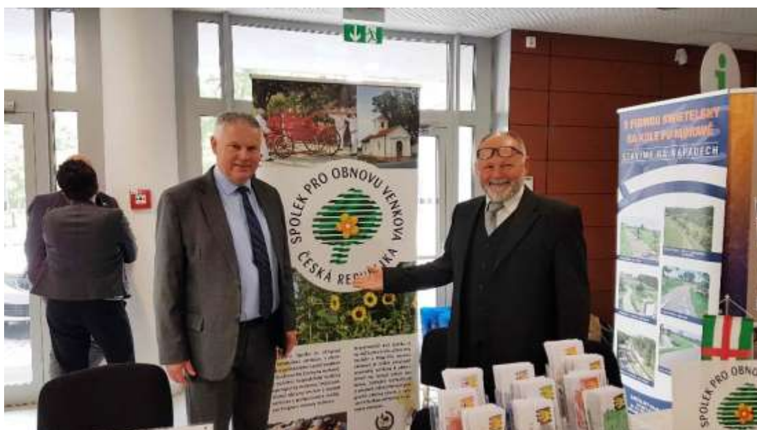
Stánek s prezentací SPOV na Dni malých obcí v Olomouci dne 23. 9. 2021.

SPOV se zde také prezentoval svojí činností na samostatném stánku.