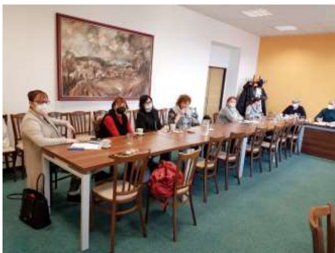
Jednání předsednictva dne 18.1.2022