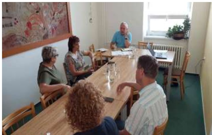
Jednání předsednictva dne 21.6. 2022