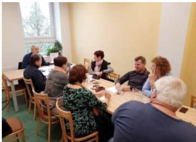
Jednání předsednictva dne 3. 11. 2022