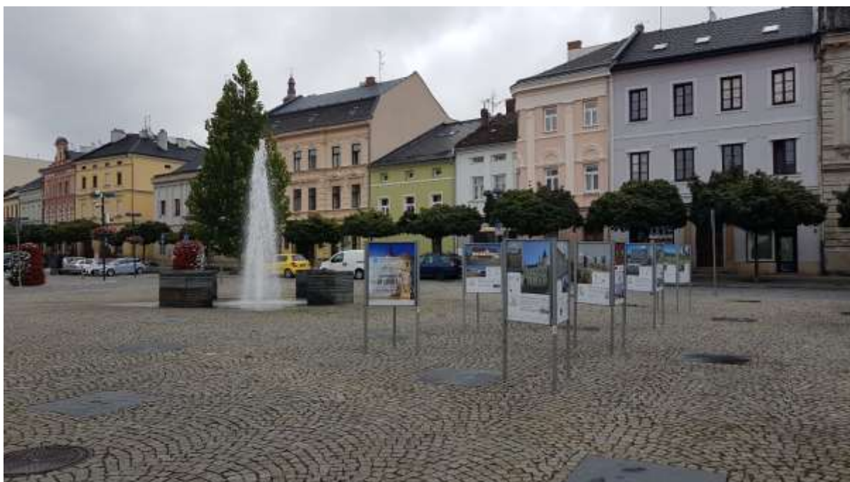
Vystavené panely s prezentovanými objekty obcí a měst na náměstí ve Šternberku.

Putovní výstava Má vlast cestami proměn přináší svědectví o příznivých proměnách zanedbaných míst a sídel v naší krajině. Díky odhodlání místních lidí a ochotě řady donorů se chátrající stavby mění v důstojné objekty s užitečnou náplní, veřejný prostor dostává novou tvář, sakrální objekty nacházejí svůj ztracený smysl a příroda se nadechuje k novému životu.