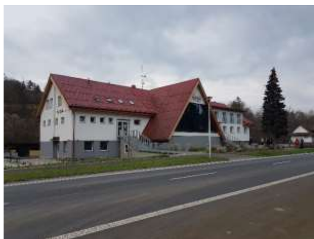
Obecní penzion Čertovy skály v Lidečku.