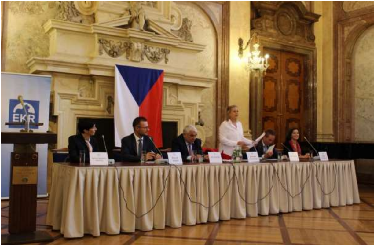
Energetický zákon a komunitní energetika Blok Ministerstva pro místní rozvoj ČR – Ivan Bartoš, služby na venkově a dotační politika. Po závěrečném slovu následovalo hudební vystoupení Komorního orchestru „Dvořákova kraje“.