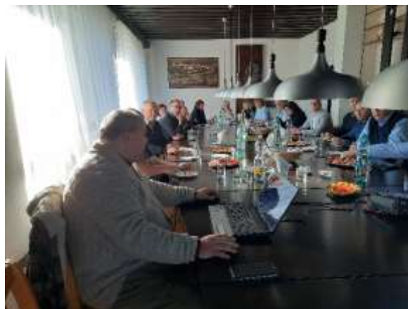
ZD Francova Lhota – prezentace činnosti.