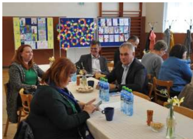
Účast členů SPOV OK na jednání valné hromady