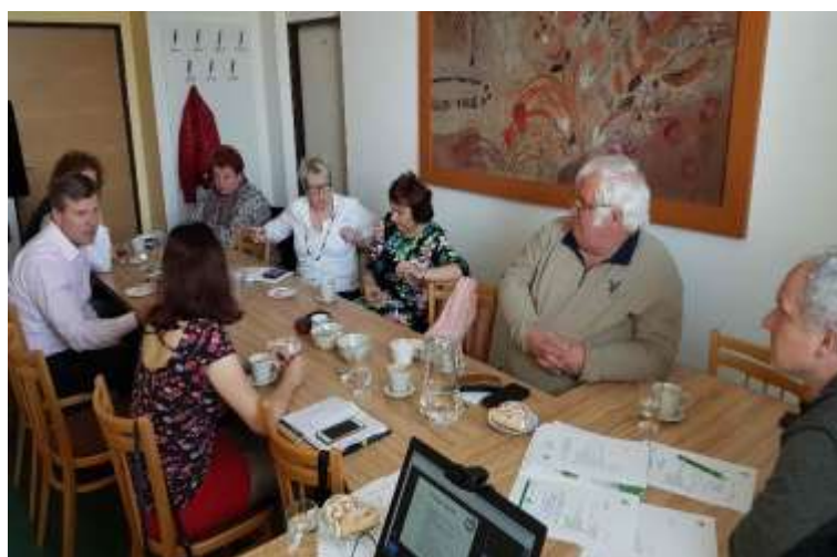
Jednání předsednictva dne 20.4.2022