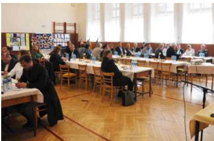
Účast členů SPOV OK na jednání valné hromady