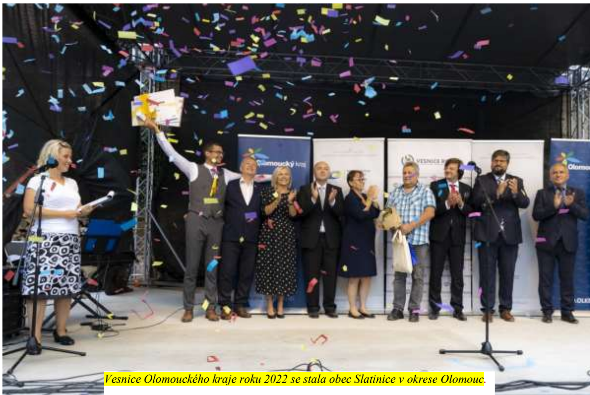
Vesnice Olomouckého kraje roku 2022 se stala obec Slatinice v okrese Olomouc.