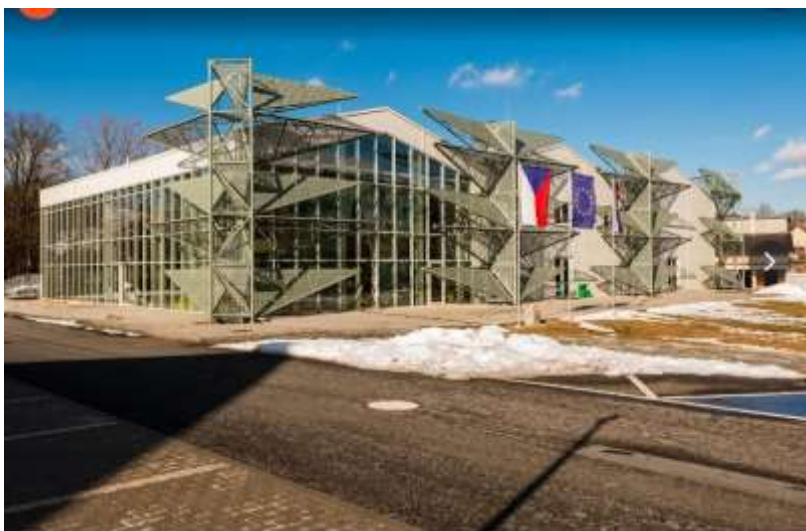
Objekt Trezoru přírody – Horní Lideč.

Druhý den dopoledne byl věnován prohlídce obce Lidečko a představení realizovaných projektů PRV 2014–2020 v obci Lidečko („Rekonstrukce zázemí pro skauty Lidečko“, „Nová fara“, obec Lidečko“, „Kulturní dům“, „Výstavba nové cyklostezky - Bečva – Vlára – Váh).