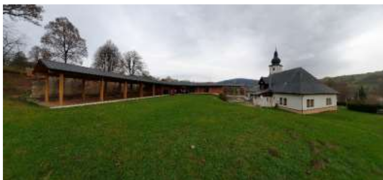
Nová fara u kostela v Lidečku.